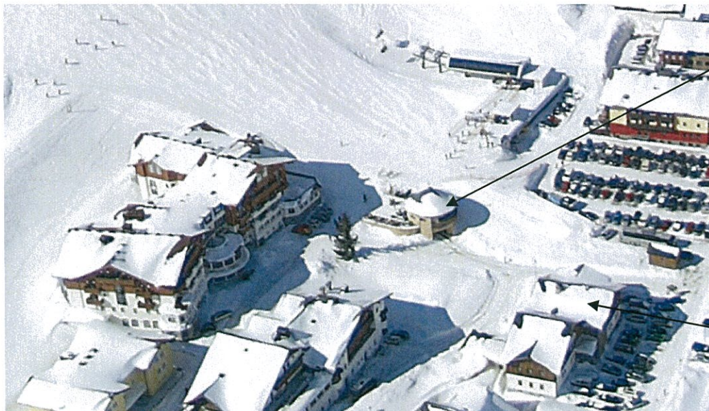
Apré Ski vor der Haustür